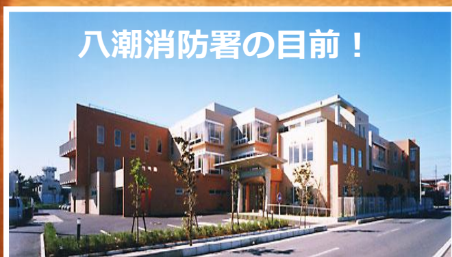
八潮消防署の目前！