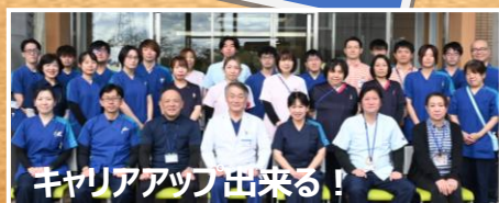
キャリアアップ出来る！