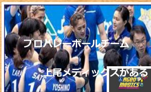
プロバレーボールチーム